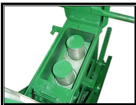
La Machine avec le Moule STABI-15 en option

1 (un) MOULE pour la fabrication des BLOCS Creux STABI-15